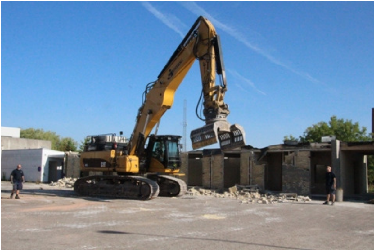
Billedet er fra kantinen på Bryggervej. d.24/7-2014