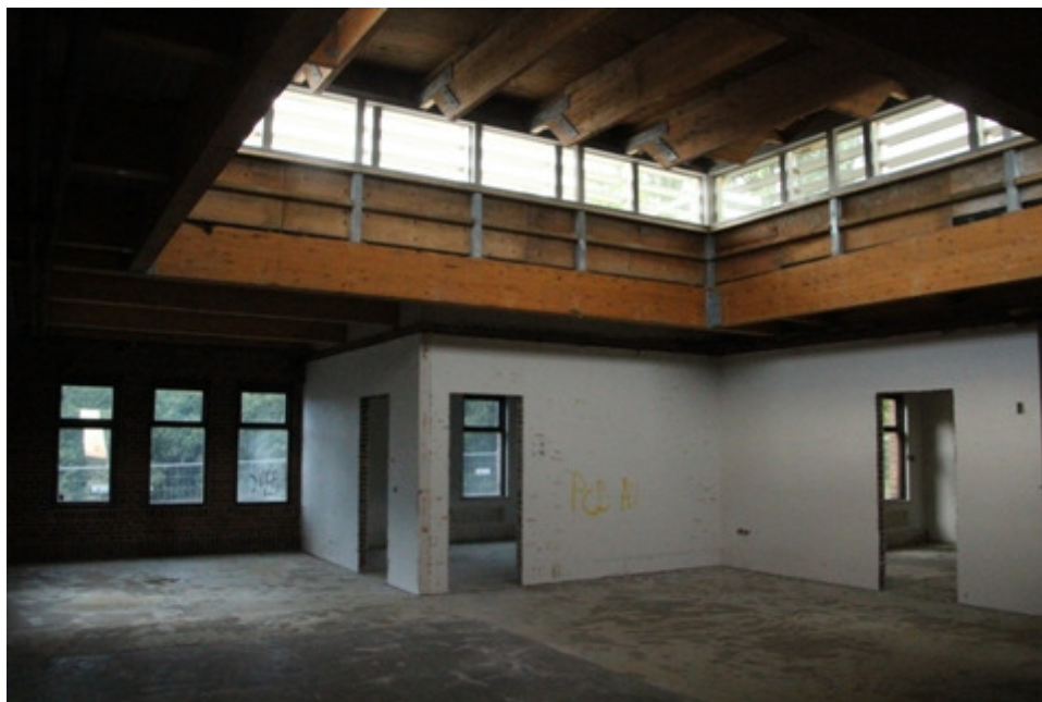
Billedet er fra Ekspeditionen på Bryggervej. d.15/7-2014

Næste fase bliver administrationsbygningen.